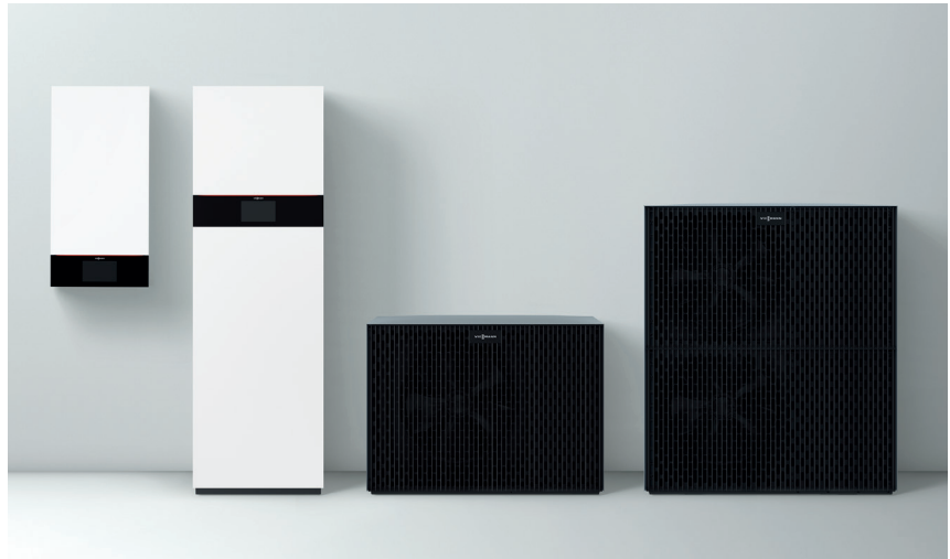
Vitocal 250-A Serie Innen- und Außeneinheiten mit einer Leistung von 2,1 bis 18,5 kW

Neu: 2,1 bis 8,0 kW/5,3 bis 18,5 kW für Neubau/Modernisierung