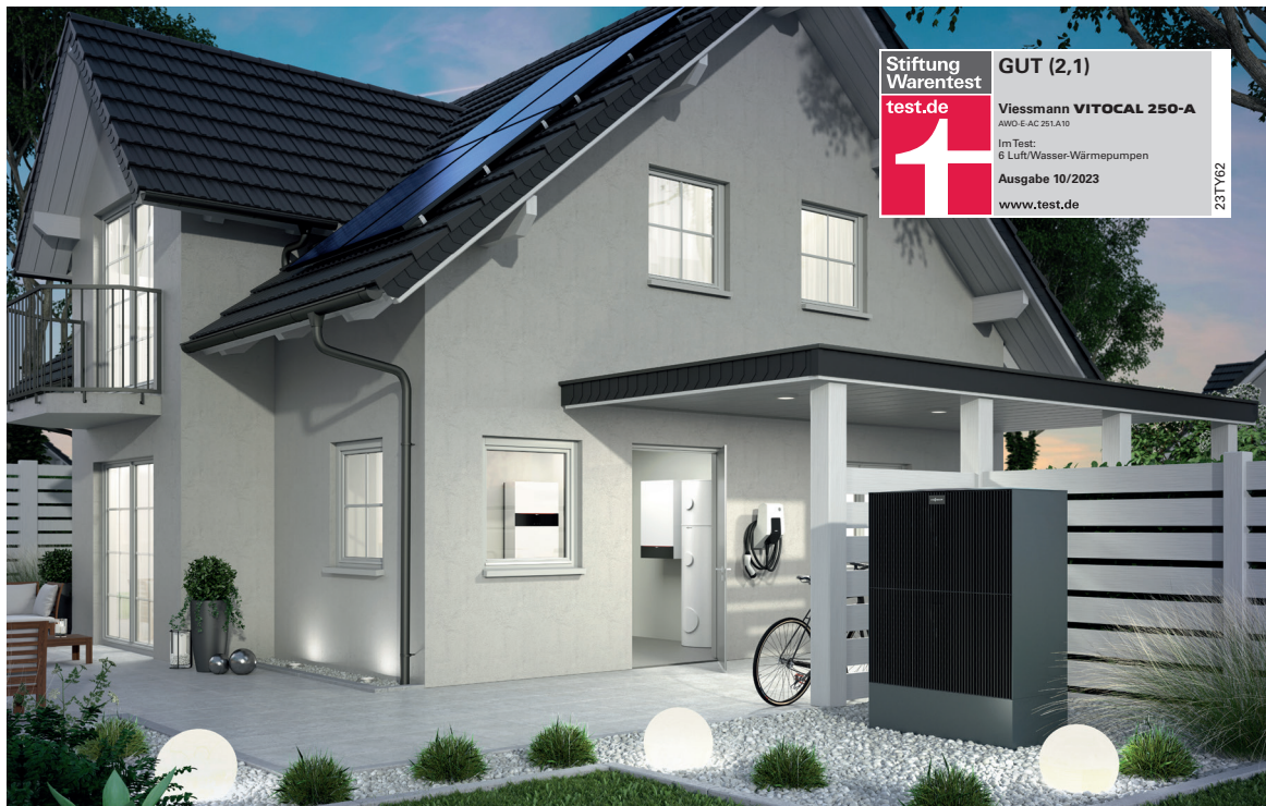
Luft/Wasser-Wärmepumpe Vitocal 250-A Innen- und Außeneinheit (2,1 bis 18,5 kW) sowie Speicher-Wassererwärmer Vitocell Modular

Stiftung Warentest vergleicht Luft/Wasser-Wärmepumpen: Testsieger ist die Vitocal 250-A von Viessmann